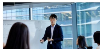
Coupa Supplier Portal - 請求書管理 >