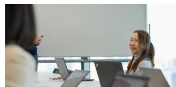
Coupa Supplier Portal 法人情報・支払先住所設定 >