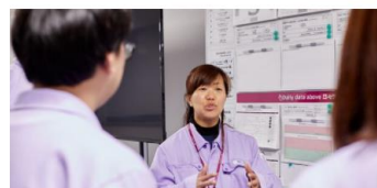
Coupaをご利用いただくアストラゼネカのお取引先様へのサポート >